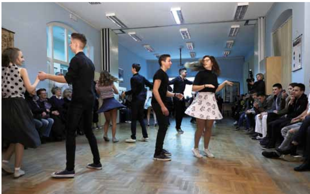
◀ Program povodom Noći muzeja u karlovačkoj gimnaziji

U ovogodišnju manifestaciju uključila su se i 4 muzeja iz Bosne i Hercegovine.