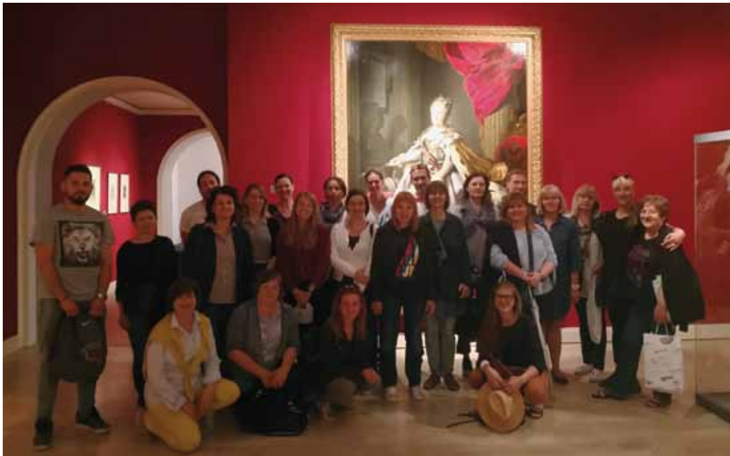
◀ Sudionici 10. Susreta u posjetu Galeriji Klovićevi dvori