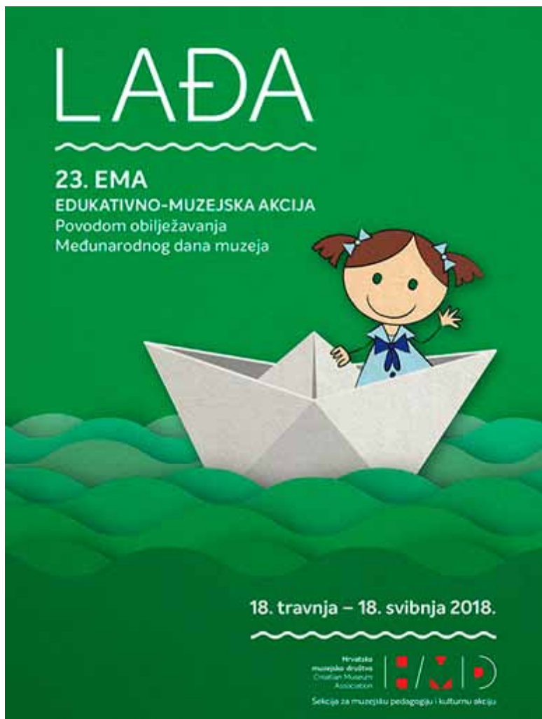
Naslovnica knjižice ~ 23. edukativne muzejske akcije Lađa