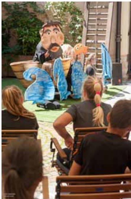
ˆ Bajka o ribaru i ribici

Zahvaljujemo Ministarstvu kulture Republike Hrvatske, Gradu Zagrebu – Gradskom uredu za kulturu i Gradu Karlovcu na financijskoj potpori projekta. Javnoj ustanovi Aquatika – Slatkovodni akvarij Karlovac i Aurori Colapis j.d.o.o. zahvaljujemo na nagradnim donacijama te svim muzejima i ustanovama koji su svojim sudjelovanjem podržali projekt. Također zahvaljujemo svim sudionicima koji su svojim entuzijazmom i ljubavlju prema baštini podržali ovogodišnju Akciju te se preporučujemo i za iduću, 24. EMA-u koja će nam temom (Pre)hrana otvoriti sva osjetila i usmjeriti nas da joj se posvetimo s filozofskog i kulturnog aspekta.