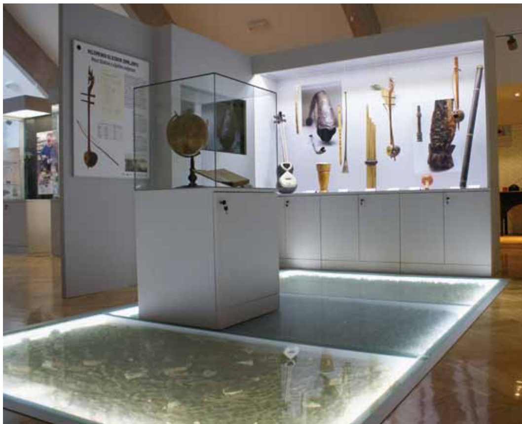
Dio stalnog postava Zavičajnog muzeja Slatina