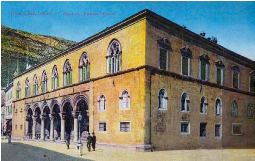
Knežev dvor, poč. 20. st., Zbirka razglednica Kulturno-povijesnog muzeja

cijelu palaču. Među vrijednom građom koja je izložena u Dvoru i od koje velik dio čine predmeti najviše umjetničke kategorije, valja istaknuti dvije renesansne slike: Krštenje Kristovo koju je za Knežev dvor 1508./09. naslikao dubrovački slikar i Mantegnin učenik Mihajlo Hamzić (druga pol. 15. st. – 1518.) te Venera i Adonis , djelo venecijanskog slikara i Tizianovog učenika Parisa Bordonea (1500. – 1571.) koja je već od 1694. resila Knežev dvor.