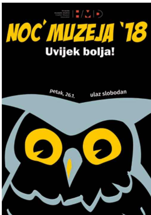
Plakat za Noć muzeja 2018.

Ovogodišnju Noć muzeja obilježila je tema Muzeji i sport , a naglasak manifestacije stavljen je na sagledavanje postojećih i stvaranje novih zbirki i muzeja na temu sporta, poticanje lokalnih inicijativa na očuvanju i usporednom vrjednovanju sporta, svih njegovih pojavnih oblika, te stvaranje pozitivnog ozračja prema sportu kao kulturološkoj vrijednosti i njegovoj prisutnosti u raznolikim oblicima društvenog i individualnog stvaralaštva.