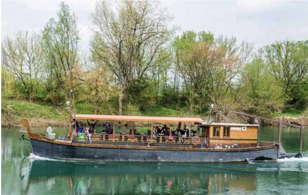
◀ Promocija Akcije na lađi „Zora”, foto: Kaportal.hr