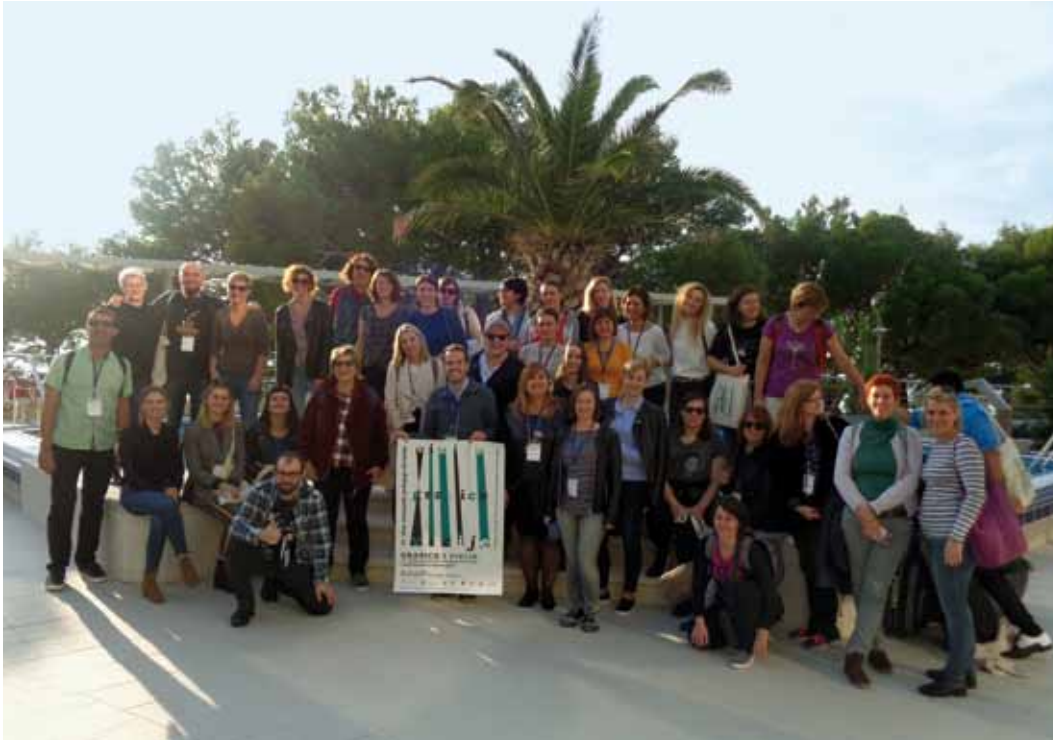
· Sudionici skupa