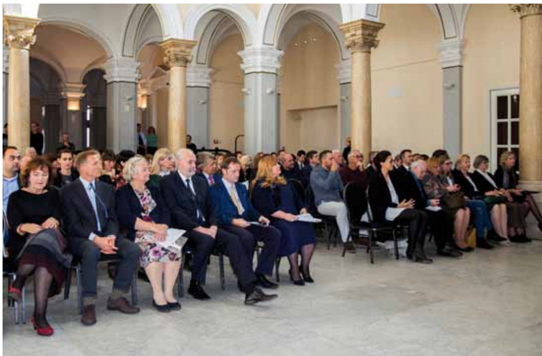
Sudionici dodjele nagrada HMD-a za 2017. godinu, Muzej Mimara

groba pronađenoga na Vučedolu, nazvana Dolka, čiji su osteološki nalazi prezentirani u Muzeju i za koju su posjetitelji iznimno vezani. Dolka postaje živi lik koji dočekuje svoje vršnjake i vodi ih kroz muzej i svijet od prije pet tisuća godina. Autorica umjetničke ilustracije je Zrinka Kukuljica Merčep. Uz Dječji vodič realiziran je i Dnevnik malog arheologa , zamišljen kao bilježnica znanstvenika/arheologa koji na terenskom istraživanju bilježi svoja zapažanja.