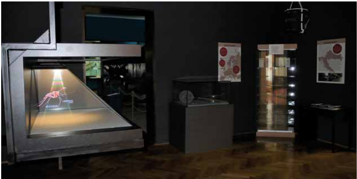
Detalj s izložbe Komarci

nije baš omiljena, što zbog njihovih uboda koji nam onemogućavaju uživanje u prirodi, što zbog zujanja koja nam remete san. A kako još neki od njih i prenose različite zarazne bolesti, ne čudi što su među omraženijim životinjama na cijelom planetu. No, koliko zapravo znamo o njima? Upravo se ovom izložbom nastoji educirati javnost i razbiti predrasude koje imamo o komarcima. Autor likovnog oblikovanja Nikša Martinac i autor oblikovanja prostora Mario Galov učinili su izložbu o komarcima vizualno dojmljivom. Posebna atrakcija izložbe jest prikaz životnog ciklusa živog komarca u akvariju, s ciljem upoznavanja morfologije njegovih razvojnih stadija. Najviše pažnje posjetitelja ipak izaziva vrlo atraktivan hologramski prikaz komarca koji su izradili Smart AV i Dario Iričanin. Osim što se izložbom javnosti predstavljaju male, ali znanstveno vrijedne muzejske zbirke komaraca u Hrvatskoj, tema izložbe je vrlo aktualna jer je postavljena baš u vrijeme sezone komaraca. Tema o komarcima kao prijenosnicima zaraznih bolesti ove je godine, možda više nego prije, iznimno aktualna. Izložba educira i upoznaje javnost s važnim biološkim karakteristikama te značajne vektorske skupine. Tako su na izložbi predstavljene i invazivne vrste komaraca, načini njihovog unosa kao i njihov snažan potencijal širenja. Vrijednost izložbe je u tome što prikazuje i brojne metode suzbijanja komaraca u Hrvatskoj i to u