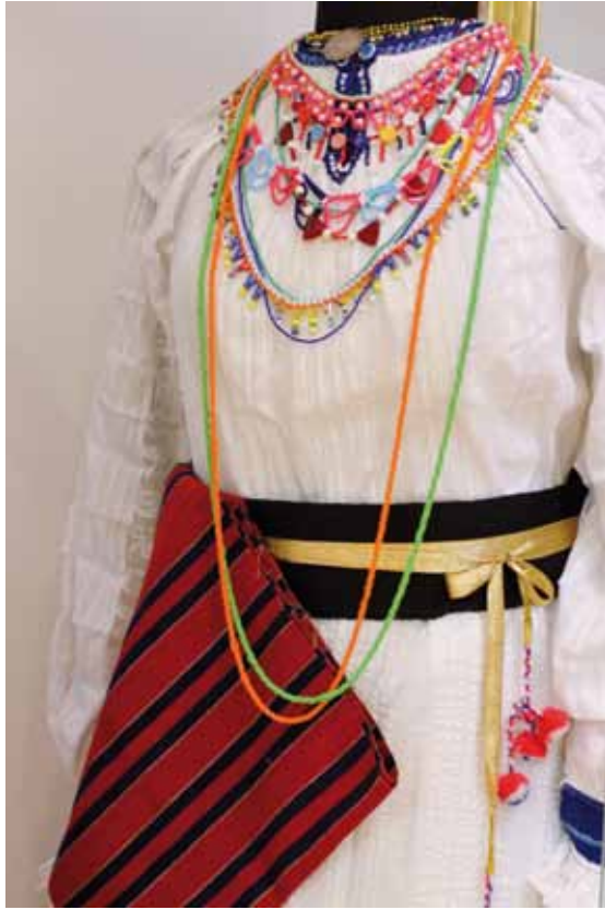
Narodna nošnja u stalnom postavu Zavičajnog muzeja Slatina

kad su se tijekom i nakon ratnih zbivanja (I. svjetski rat, II. svjetski rat) dogodile najveće demografske i kulturološke promjene. Podatci vezani uz vrijeme XIX. i XX. stoljeća vezani su uz razvoj gospodarskih prilika, društvenih odnosa, napretka statusa grada, kulture, sporta i sličnih tema. Povijesna slika Slatine uključit će i život u socijalističkoj Jugoslaviji kada je Slatina imala ime Podravska Slatina. Završit će prikazom formiranja samostalne hrvatske države, Domovinskim ratom i naglaskom na doprinos 136. slatinske brigade i poginulih Slatinčana oslobođenju slatinskog kraja, ali i ostalog dijela Hrvatske. (Naknadno je u prizemlju, neposredno do prostori- je Udruge roditelja poginulih branitelja, postavljen na puno većem prostoru stalni postav Domovinskog rata na slatinskom području, koji je otvoren 2014. godine.)