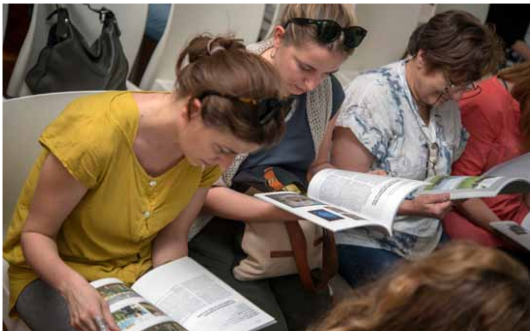
◀ Nova publikacija