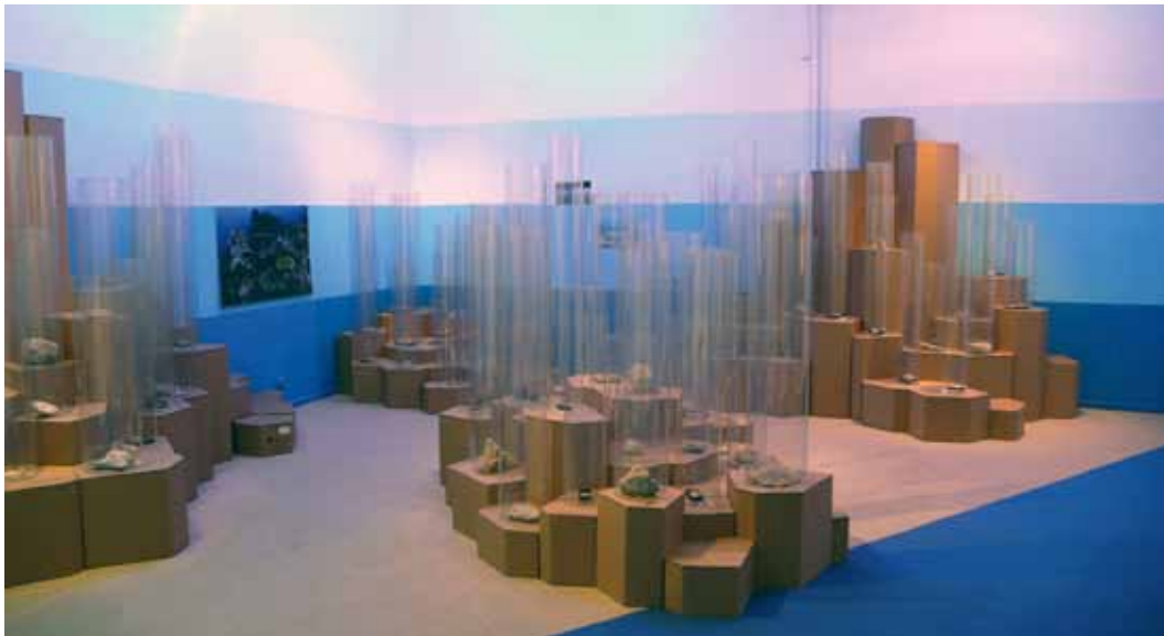
◀ Detalj s izložbe Miocen