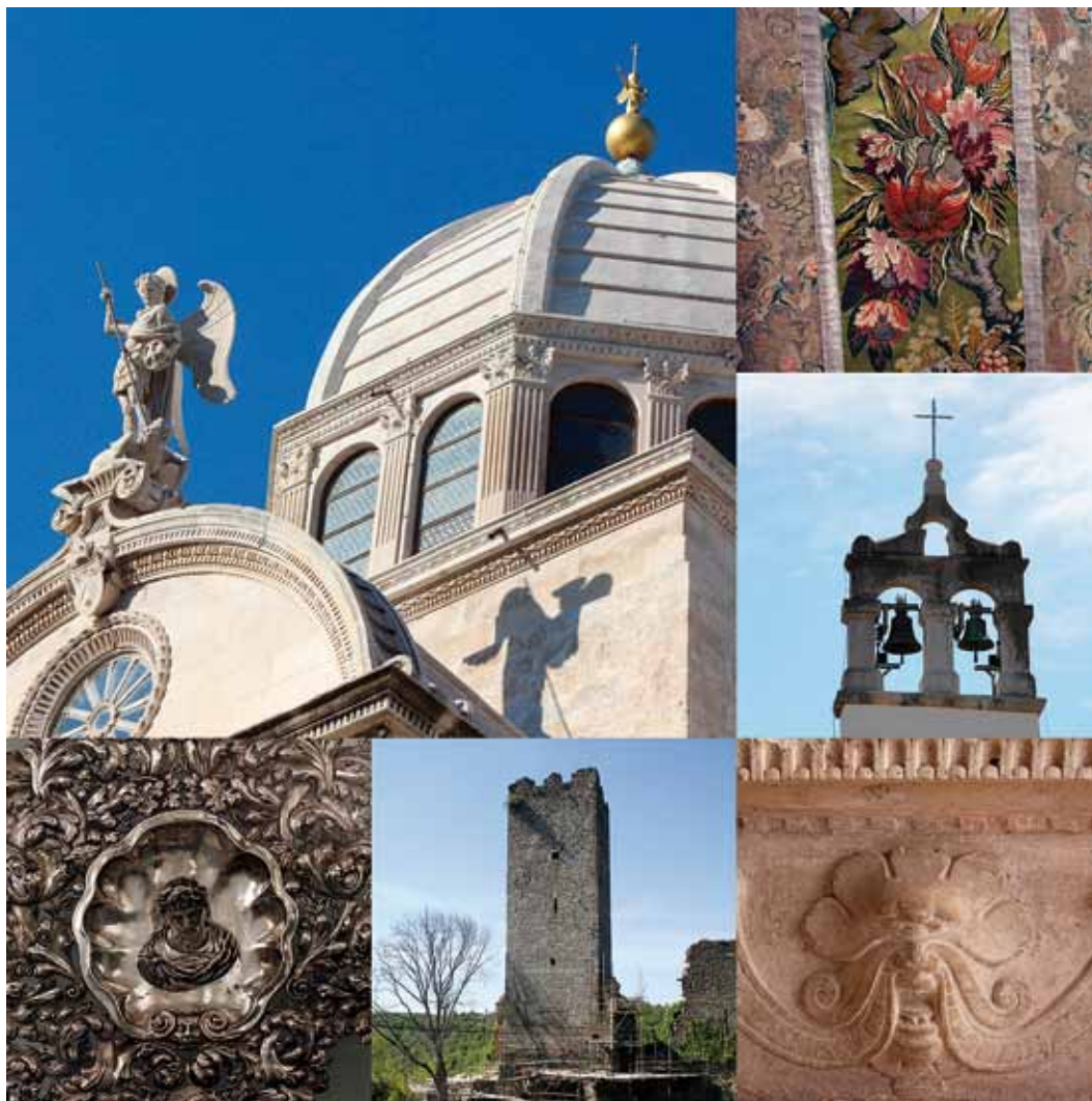
◀ Kolaž fotografija hrvatske kulturne baštine, foto: Gordana Jerabek

novih radnih mjesta i privrednog napretka, ali se željela osvijestiti i obveza koju nam neprocjenjiva vrijednost baštine ostavlja u zadatak, a to je da potaknemo djecu i mlade na zaštitu i očuvanje onoga što im je ostavljeno u naslijeđe.