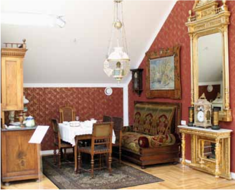
Dio stalnog postava ~ Zavičajnog muzeja Slatina

ustvari završili godine 2018. kad je uređena radionica muzejskog tehničara, kao i u međuvremenu dodijeljena prostorija za muzejsku suvenirnicu, obje u prizemlju zgrade.