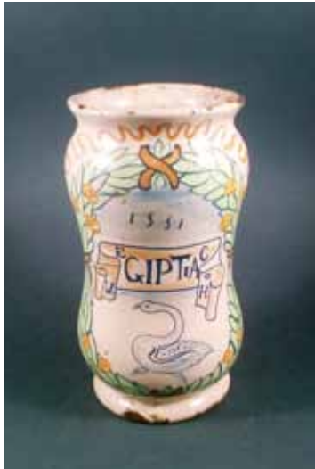
Stojnica s natpisom - Egiptiac, Savona (?), 1531., fajansa, visina 20 cm, inv. br. HMMF- 2943 (najstarija u Zbirci; iz zbirke Farmaceutskog društva Hrvatske)

Sljedeću podzbirku čine staklene stojnice, uključujući i one od mliječnog stakla, a obuhvaća 200 stojnica različitih oblika. Najviše je četvrtastih, ima cilindričnih i u obliku vaze. Razlikuju se i u dimenzijama, od veoma malih (vjerojatno za neke skupe i rijetke sastojke) do onih većih. Oslikane su, najčešće kartušom u kojoj je natpis, a vrlo često pojavljuje se ptica iznad natpisa.