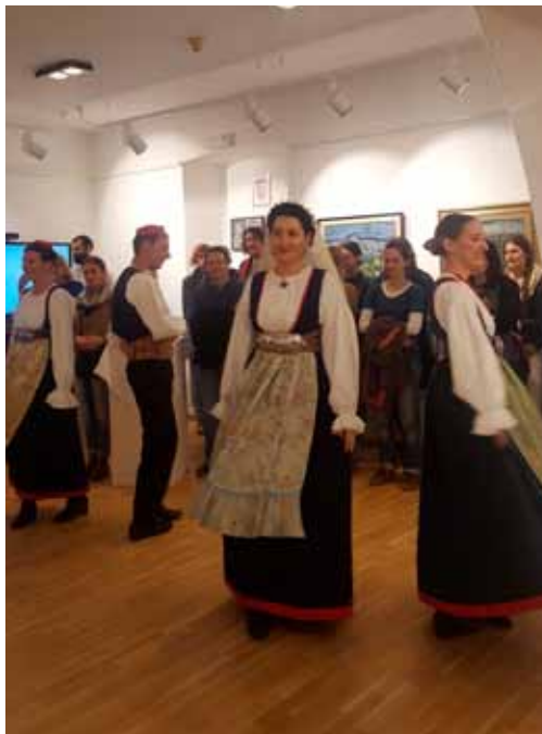
◀ Nastup folklornog društva

U Zborniku radova 9. skupa muzejskih pedagoga Hrvatske s međunarodnim sudjelovanjem objavljen je ukupno 31 rad. Radovi su podijeljeni u 4 tematske cjeline prema programu održanog Skupa. Na kraju Zbornika nalazi se i službeni zaključak nastao kao rezultat rada i rasprava ovog stručnog okupljanja kolegica i kolega iz područja muzejske edukacije.