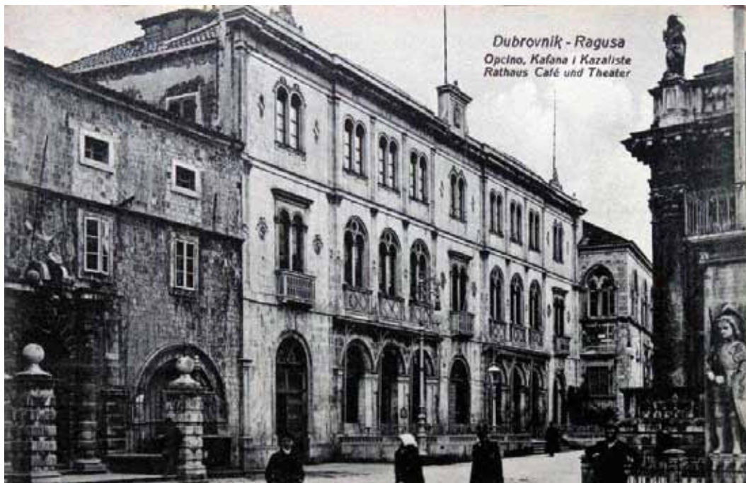
« Antun Drobac, fotografija iz Zbirke fotografija i fotomaterijala Kulturno-povijesnog muzeja