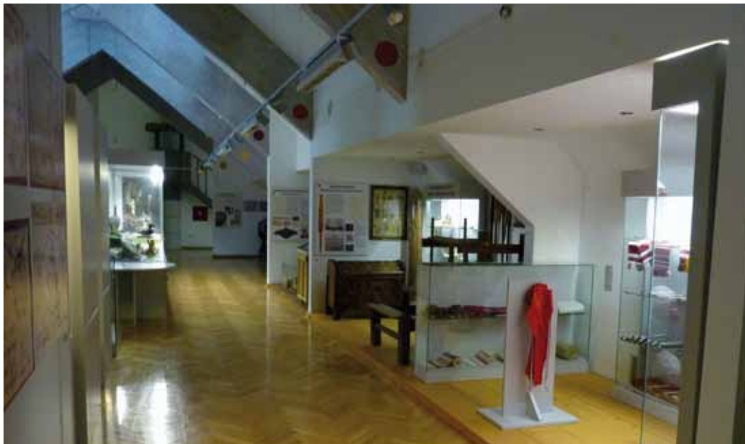
◀ Perspektivni pogled na stalni postav Zavičajnog muzeja Slatina

Hrvatske 1 i Odluke o osnivanju Zavičajnog muzeja Slatina Gradskog vijeća grada Slatina. 2 Nakon 22 godine rada u sastavu krovne ustanove Zavičajni muzej Slatina od 1. kolovoza 2006. djeluje kao samostalna kulturna ustanova. U Muzeju su stalno zaposlene dvije osobe – što odgovara neophodnom uvjetu za donošenje odluke o osnivanju Muzeja – jedan kustos i jedan muzejski tehničar, postojala je muzejska građa i određeni (privremeni) prostor za rad u suterenskom dijelu zgrade navedenog Pučkoga otvorenog učilišta.