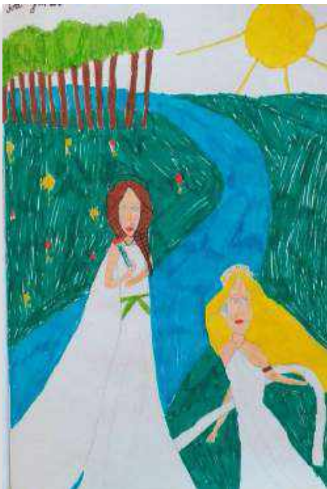
SLIKA 2. Jedan od pristiglih dječjih radova

Okrenuli smo se društvenim mrežama, konkretno u našem slučaju radilo se o Facebook stranici Muzeja. Zahvaljujući ranije spomenutoj suradnji s Bajkopričalicom, na Facebook stranicu smo postavili audio zapis iz radio emisije Pidžama u kojoj je interpretirana bajka Tajna vilinskih suza . Zadatak za naše pratitelje bio je da poslušaju bajku i na temelju odslušanog nacrtaju svoju vilu. Radove je, uz podatke o autoru crteža, trebalo poslati u pretinac dolazne pošte ( inbox ) do određenog datuma te čekati objavu s podacima o najboljim radovima.