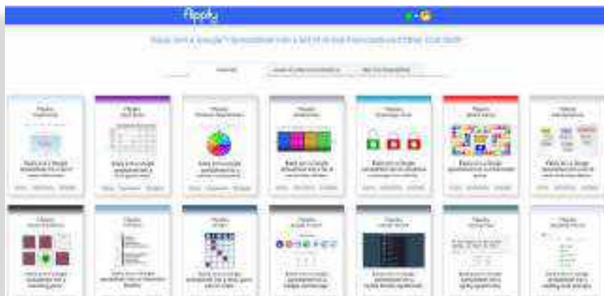
SLIKA 3. Obrasci za (pre)oblikovanje igara u alatu Flippity.net

može prilagoditi svojim potrebama (slika 3).