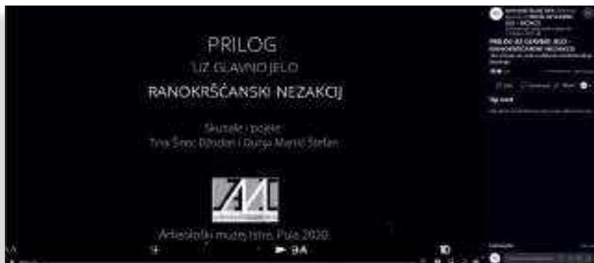
SLIKA 2. Odjavna špica Priloga uz glavno jelo

po spomenutoj izložbi snimljeno je upravo prema pozivu TNMT-a te je odlučeno da se nastavi s istim formatom i svakog četvrtka objavi novi edukativni video.