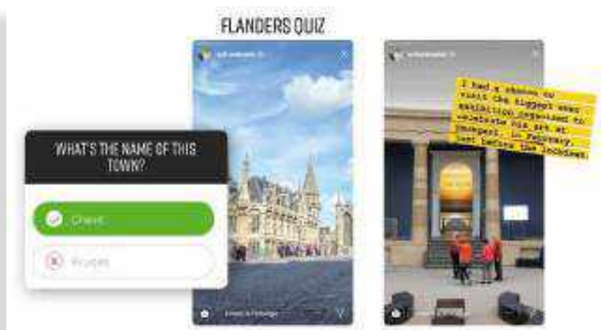
SLIKA 3. Instagram storyji s kvizom te animativostima s izložbe Van Eyck. An Optical Revolution

Prezentirajući skupine djela, poput van Eyckovih sekularnih portreta, zajednički smo šetali izložbom. Unutar Instagram 51 i Facebook 52 priča ( story ) dijelili smo kratke video klipove te vrlo popularne kvizove (slika 3).