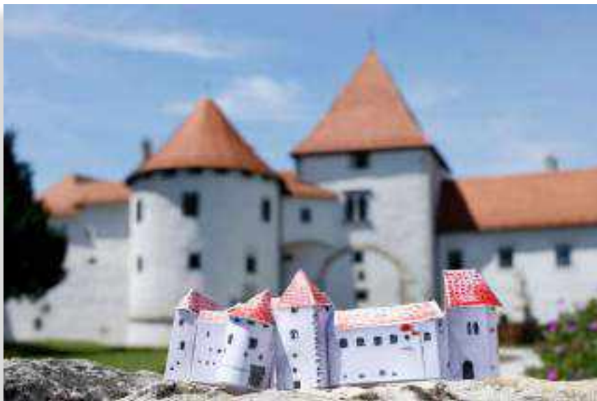
SLIKA 2. Primjer izrađene makete s radionica Stari grad, novi putevi (autor: Andrej Švooger)

njenu umjetnost u Rijeci). Sama ova činjenica poslužila je i kao dobra podloga za buduće suradnje javnih ustanova u sklopu projekta, te je, stoga, za učenike Škole za primijenjenu umjetnost u Rijeci osmišljeno edukativno vodstvo kroz koje su učenici 1., 2. i 3. razreda posjetili Gradski muzej Varaždin, i to odjele koji se muzejskim postavom i izloženim predmetima vežu uz nastavne cjeline i školski kurikulum.