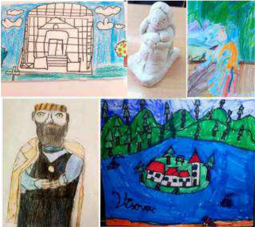
SLIKA 3. Izbor učeničkih radova s 25. EMA-e: Ljubav prema rodnome kraju, 2020. godine

Termin manifestacije također se prilagodio novonastaloj situaciji, te je ona održana tijekom svibnja i lipnja (umjesto dotad ustaljenog termina 18. travnja - 18. svibnja). Pokazalo se da su muzeji sposobni odgovoriti na nove, nepredviđene situacije zbog snalažljivosti i spremnosti na osmišljavanje kreativnih rješenja. Ali ipak, moramo priznati da Akcija provedena posredstvom internetskih, online alata nije bila ni približno toliko uspješna koliko bi bila da se odvijala uživo, u prostorijama Muzeja. Komunikacija s djecom je bila otežana, nekad je bilo gotovo nemoguće doći do njih i nagovoriti ih da se posvete radionici jer je uglavnom nisu shvaćali kao kreativni predah, nego kao još jednu školsku zadaću, koju, pak, nisu obavezni izvršiti. Pandemija je i muzejskim i obrazovnim ustanovama ukazala na slabe točke koje se pojavljuju u takvim izvanrednim okolnostima, no istodobno i nas je nagnala da se zajedničkim snagama nastojimo izdignuti iznad teškoća koje su se pojavljivale.