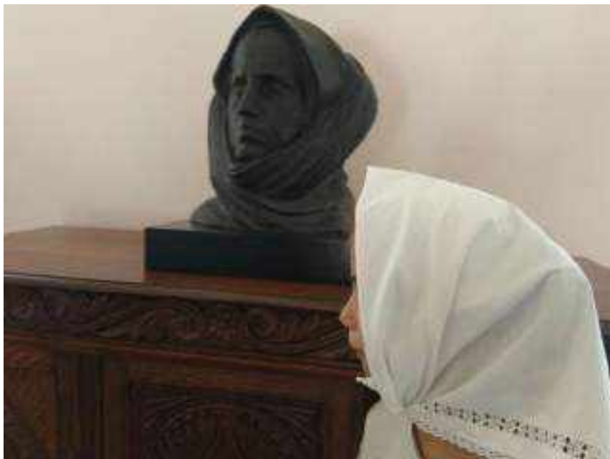
SLIKA 1. Moja majka i okruga – tematsko vođenje. Autor I. M., vlasništvo Muzeja Ivana Meštrovića