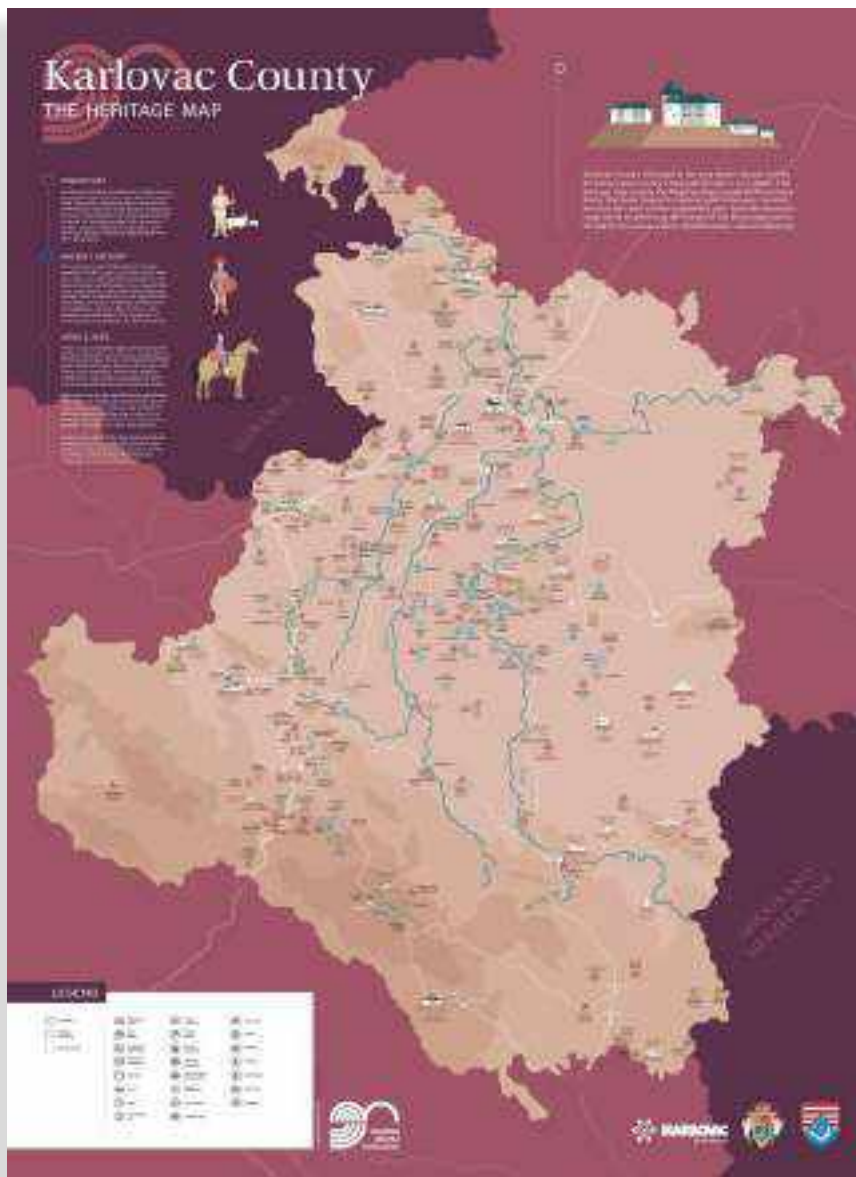
SLIKA 2. Karta baštine na engleskom jeziku

kaliteta, značajni pojedinačni nalazi, stari gradovi, najvažniji sakralni objekti, naseobinski horizonti, špiljski lokaliteti, kamenolomi, podvodni lokaliteti i dr. Kartu bismo mogli nazvati i okarakterizirati arheološkom, ali pojam baštine nam se činio nadređen ostalim opisnim nazivima.