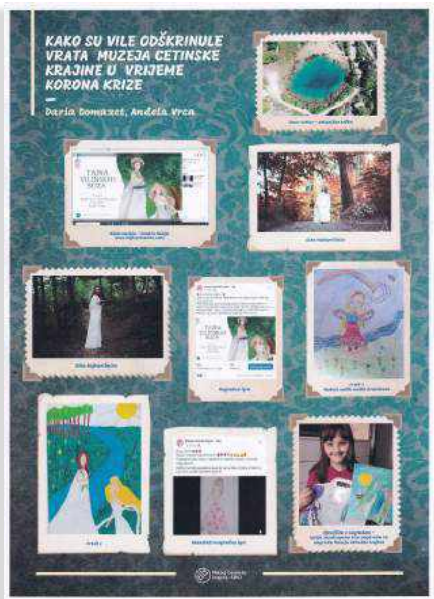
SLIKA 3. Plakat MCK – Sinj s 11. skupa muzejskih pedagoga Hrvatske

da promišljaju o novim načinima približavanja publici te da kroz svoju kreativnost sačuvaju staru i privuku novu publiku. Zatvorena vrata muzeja i virtualna komunikacija dokazali su da se muzealci mogu uhvatiti u koštac sa situacijom krize i otkriti svu širinu svoje kreativnosti, koja možda ne bi dosegla ovu razinu da je situacija bila „normalna“ (slika 3).