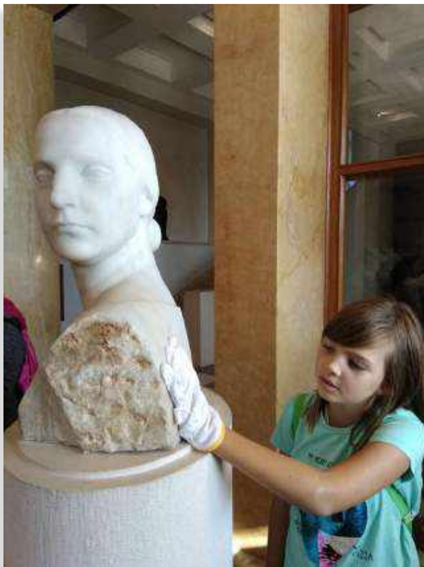
SLIKA 2. Dodirni i osjeti – senzorno vođenje. Autor I. M., vlasništvo Muzeja Ivana Meštrovića

liziranom prikazu vidljiva i kod drugih Meštrovićevih skulptura ( Povijest Hrvata, Karijatida I., Karijatida II. ). Uz izložene Meštrovićeve skulpture u stalnom postavu Galerije Meštrović, sama tema vodstva se odlično uklopila u nastavni program Prirode i društva nižih razreda (tema zavičaja i kulturne baštine) te je potaknula cijeli niz pitanja za razgovor. Tako sudionici mogu doznati za što je marama služila žena-