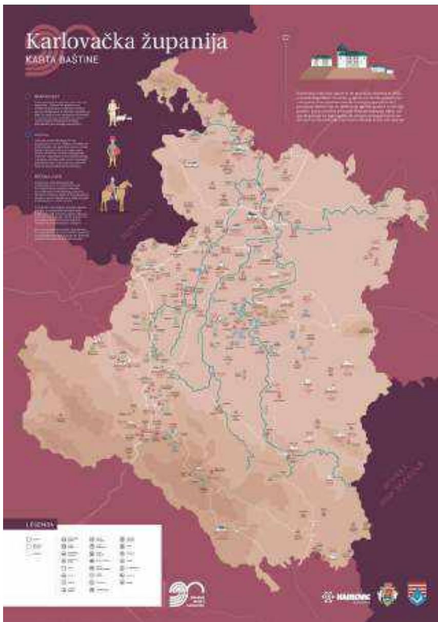
SLIKA 1. Karta baštine na hrvatskom jeziku

skog muzeja Karlovac Igor Čulig i Matea Galetić, na temelju prethodnih terenskih istraživanja konzervatora arheologa Krešimira Raguža i Domagoja Perkića, arhivskog i kabinetskog istraživanja te sveukupnih arheoloških istraživanja na području Županije. Sačinjava je odabir od 200-tinjak arheoloških prapovijesnih, antičkih i srednjovjekovnih lo-