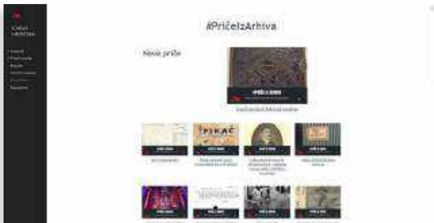
SLIKA 2. Virtualna izložba #PričelzArhiva 38

2021. održana je serija online predavanja i radionica u kojima su arhivisti i drugi baštinski stručnjaci predstavili arhivske priče iz javnih i privatnih spremišta i zbirki. 39