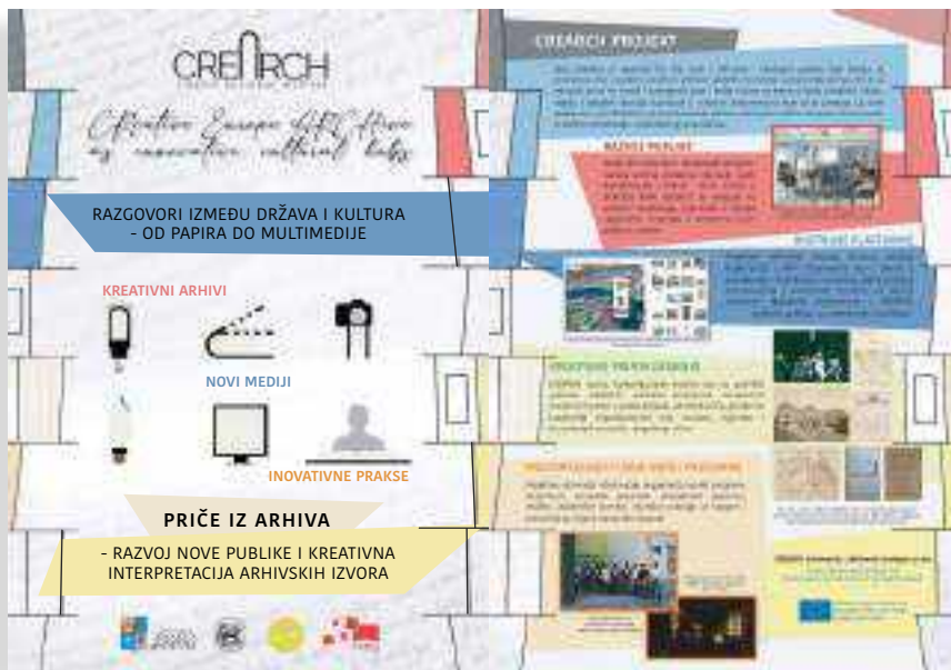
SLIKA 1. Promotivni materijali CREARCH projekta 36

arhivima, uz primjenu suvremene vizualne/digitalne kulture u opisu arhivskih priča te realizirati kreativno pripovijedanje kroz vizualne, digitalne i transmedijske izvedbe i događanja uživo. Planirane aktivnosti u okviru projekta uključuju izradu plana razvoja publike, edukaciju baštinskih stručnjaka, razvoj mobilne aplikacije za povezivanje s publikom (lov na blago) i raznovrsne kulturne programe koji omogućuju interakciju arhiva s različitim korisničkim skupinama (slika 1).