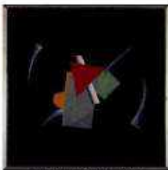
Josp Seissel, Papirna , 1922.

Početak 20. stoljeća pojavili su se umjetnici koji su smatrali da umjetnički rad ne mora nužno oponašati prirodu kako bi bio razumljiv. Po njima su i najjednostavniji oblici bili dovoljni za izražavanje misli i komuniciranje svojih misli s drugima. Umalo nerazumjevanju u kojem se u početku često susretala, a susreće se i dan-danas, apstrakcija je postala jedan od dominantnih načina izražavanja u umjetnosti 20. i 21. stoljeća.