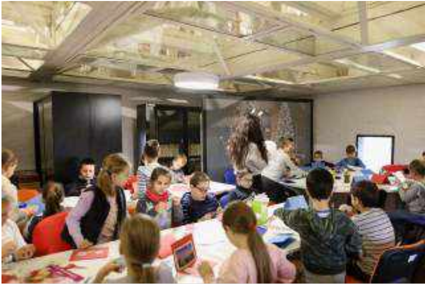
SLIKA 1. Božićne radionice u novouređenom multimedijском prostoru

Staroga grada. Uz to, radionica je osmišljena s ciljem uvježbavanja finih motoričkih vještina, prijeko potrebnih za razvoj svakog djeteta, što je postignuto izrezivanjem, presavijanjem te lijepljenjem pojedinih arhitektonskih dijelova utvrde. Svakoј radionici prethodilo je edukativno vodstvo utvrdom Stari grad kako bi se učenici bolje upoznali s arhitektonskim dijelovima iste. Radionice su se svakodnevno održavale od 09. do 13. ožujka 2020., u dva ponuđena termina. Za potrebe održavanja radionica osmišljen je i izrađen edukativni listić s arhitektonskim dijelovima utvrde Stari grad u suradnji s grafičkom dizajnericom. Na radionicama Stari grad, novi putevi prisustvovalе su sljedeće škole: Prva osnovna škola Varaždin, Gospodarska škola Varaždin, Osnovna škola Trnovec, Srednja strukovna škola, Osnovna škola Šemovec i Šesta osnovna škola, i to ukupno 10 razreda, to jest 193 učenika na 8 održanih radionica (slika 2).